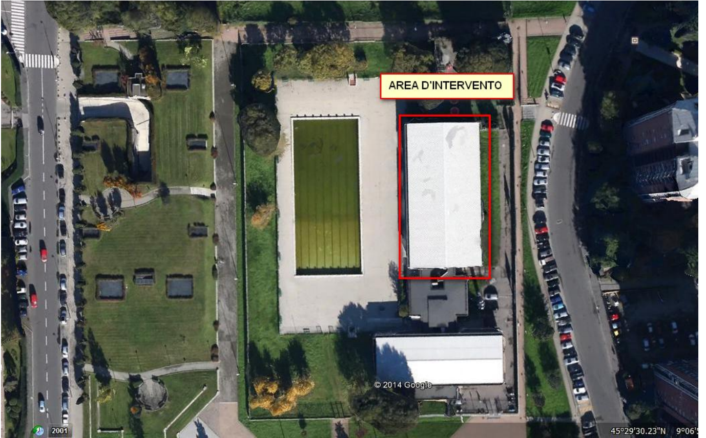
VISTA AEREA 1