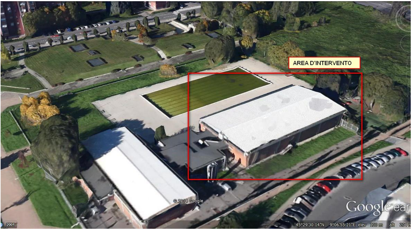
VISTA AEREA 3